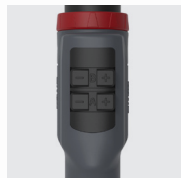
2 U/D, 2U/DX