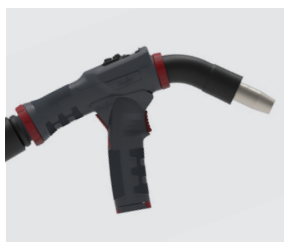
Impugnatura a pistola ((dis)installabile senza utensili)

Disponibile anche in versione X LED senza dispositivo di comando