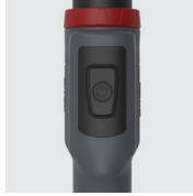
Pulsador de la antorcha arriba