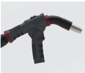
Asa de pistola (puede montarse y desmontarse sin herramientas)