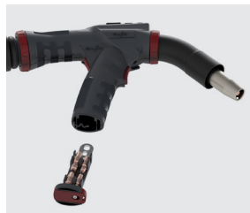
Asa de pistola con depósito integrado para almacenar la llave de la antorcha y los dos tubos de contacto