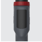
Стандартное исполнение с заглушкой