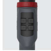
2 U/D, 2U/DX