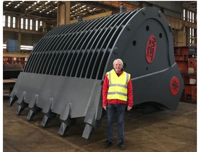
Die Siebschaufel hat ein Volumen von 25 m 3 und wird für die Gewinnung von Gestein am Meeresboden verwendet, wobei der Schlick zurückbleibt.

Damit die Schaufeln schnell wieder einsatzbereit sind, sind Schnelligkeit und hohe Qualität gefragt. Nur so lassen sich Maschinenstillstände der teuren Bagger vermeiden. Die Reparaturen sollen die Qualität der Originalschaufel aber nicht nur erreichen, sondern möglichst noch übertreffen. Grundlage dafür sind hochwertige und zuverlässige Verbrauchsmaterialien sowie perfekt abgestimmte Verfahren.