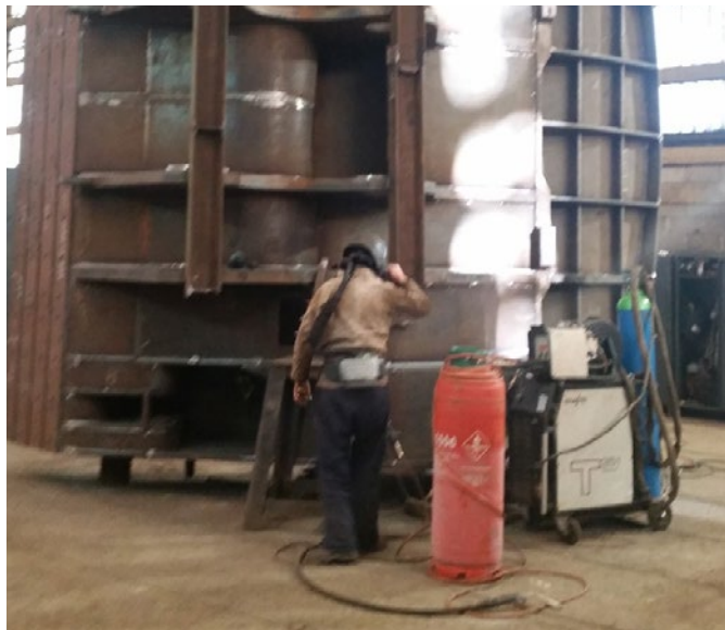
Mit seinen Abmessungen von 5.640 x 4.550 x 4.820 mm und einem Gesamtgewicht von 70 Tonnen hat der Hochlöffel PC8000 ein Volumen von 42 m 3 . Er wird bei der Gewinnung von Ölsand in Kanada eingesetzt.