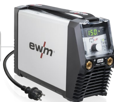
Pico 160 cel puls