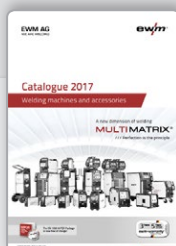
Catálogo Máquinas de soldadura y accesorios