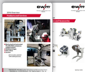
Folleto de mecanización Productos y servicios Componentes y accesorios