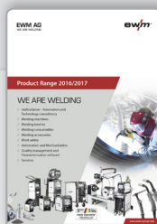
Folleto Programa de productos, servicios