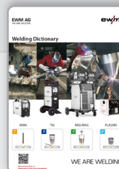
Manual de instrucciones Glosario de soldadura EWM

EWM AG Dr. Günter-Henle-Straße 8 | D-56271 Mündersbach Tel: +49 2680 181-0 · Fax: -244 www.ewm-group.com | www.ewm-sales.com info@ewm-group.com