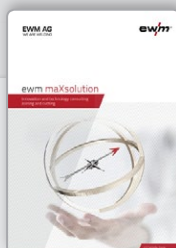
Folleto maXsolution – Asesoramiento en tecnología e innovación