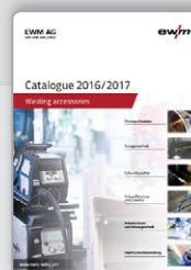
Catálogo Accesorios técnicos de soldadura