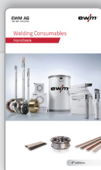
Manual de instrucciones Consumibles de soldadura