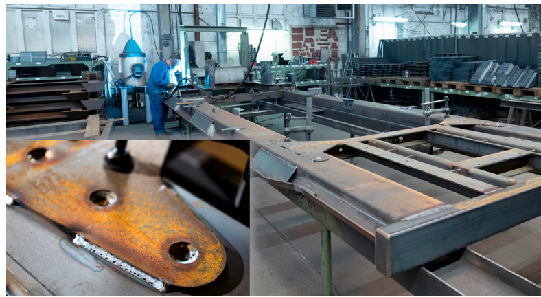
Das innovative Schweißverfahren forceArc puls wird in allen Bereichen des Stahlbaus zum Verschweißen unbehandelten Schwarzstahls eingesetzt. Die Prozesssicherheit ist hoch und die nahezu spritzerfreie Naht perfekt.