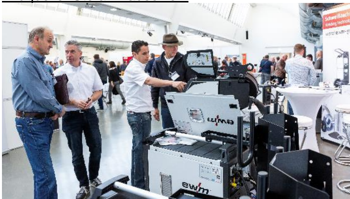
Abb. 1:

Als Partner des Metallhandwerks unterstützt die EWM AG den Metallbaukongress. Der Schweißtechnik-Hersteller freute sich über zahlreiche Fachgespräche mit den interessierten Besuchern.